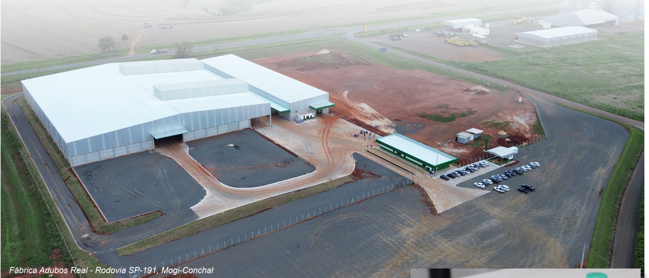
Fábrica Adubos Real - Rodovia SP-191, Mogi-Conchal

Aconteceu na terça-feira (2) o ato de inauguração da unidade de Mogi Mirim da empresa de fertilizantes Adubos Real. Com um investimento de cerca de R$ 50 milhões, a nova unidade está localizada em um terreno de 85 mil m 2 localizado no Km 6 da Rodovia Wilson Finardi (SP-191). Em sua