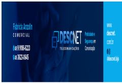
image001.png 108 KB