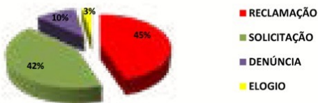
CANAIS DE ATENDIMENTO